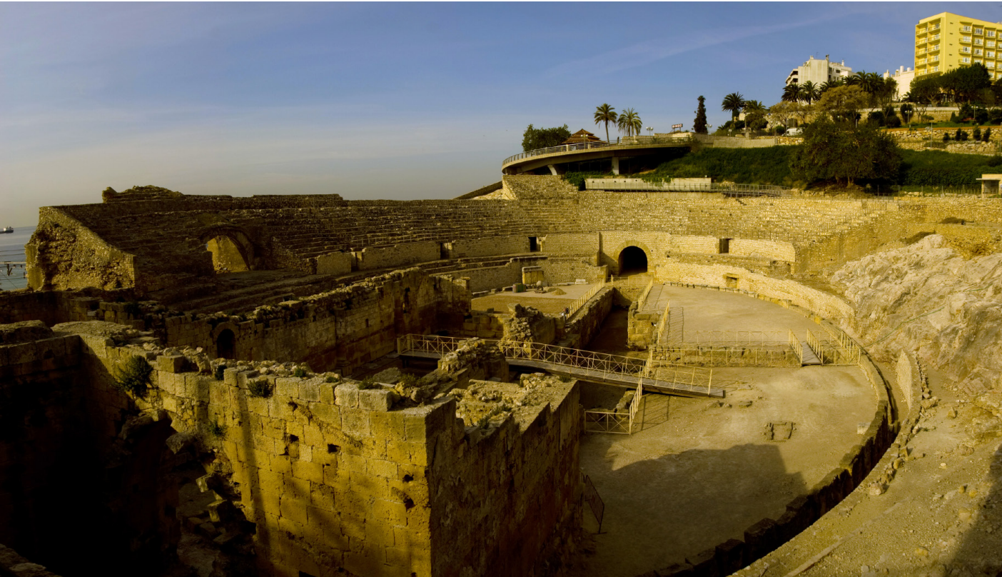
Ruta por la Tarragona Romana